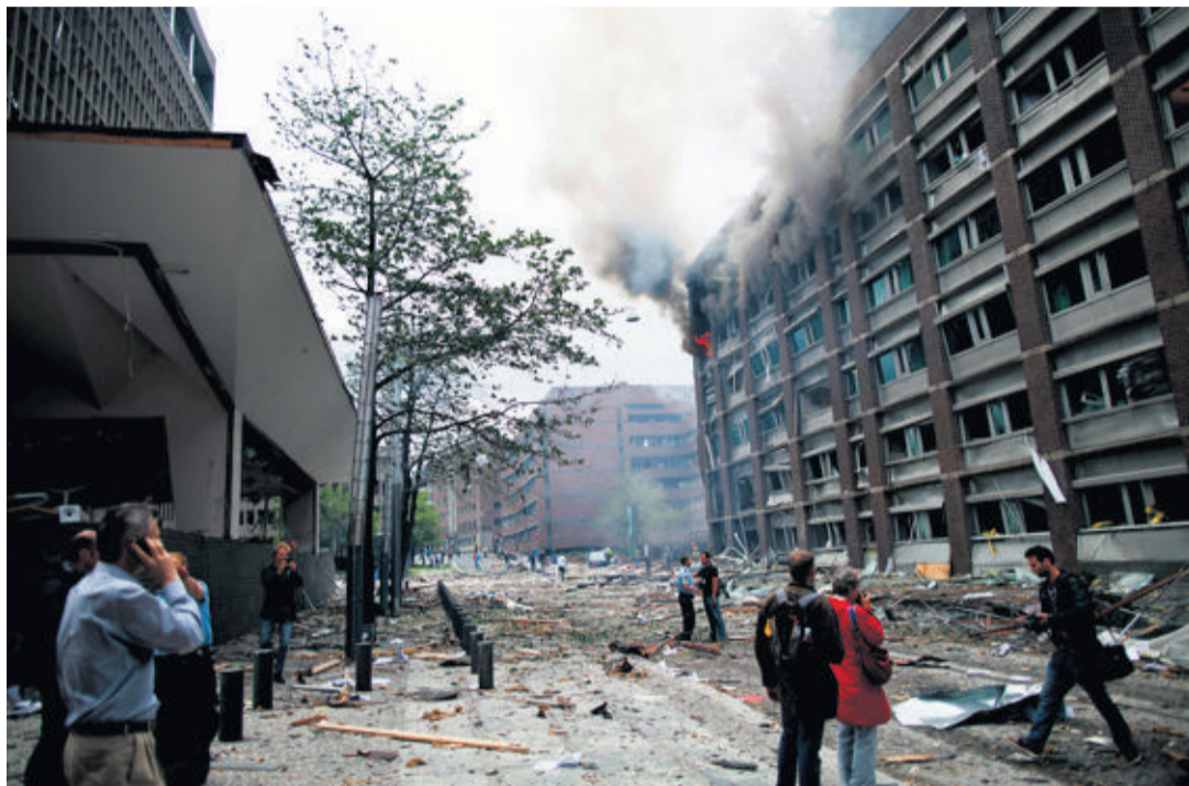
A Oslo, les vitres des bâtiments gouvernementaux ont volé en éclats. Des blessés gisaient dans la rue, au milieu de débris de verre et de mobilier.

Le plus inquiétant est que dans les deux cas, les attaques ont pris pour cibles des lieux où le premier ministre Jens Stoltenberg était censé se trouver. Indemne, il est intervenu sur les ondes pour montrer qu'il était sain et sauf avant de qualifier la situation de «très grave» et de lancer: «Nous sommes tous Norvégiens.» Dans la soirée, le gouvernement a été convoqué pour une réunion de